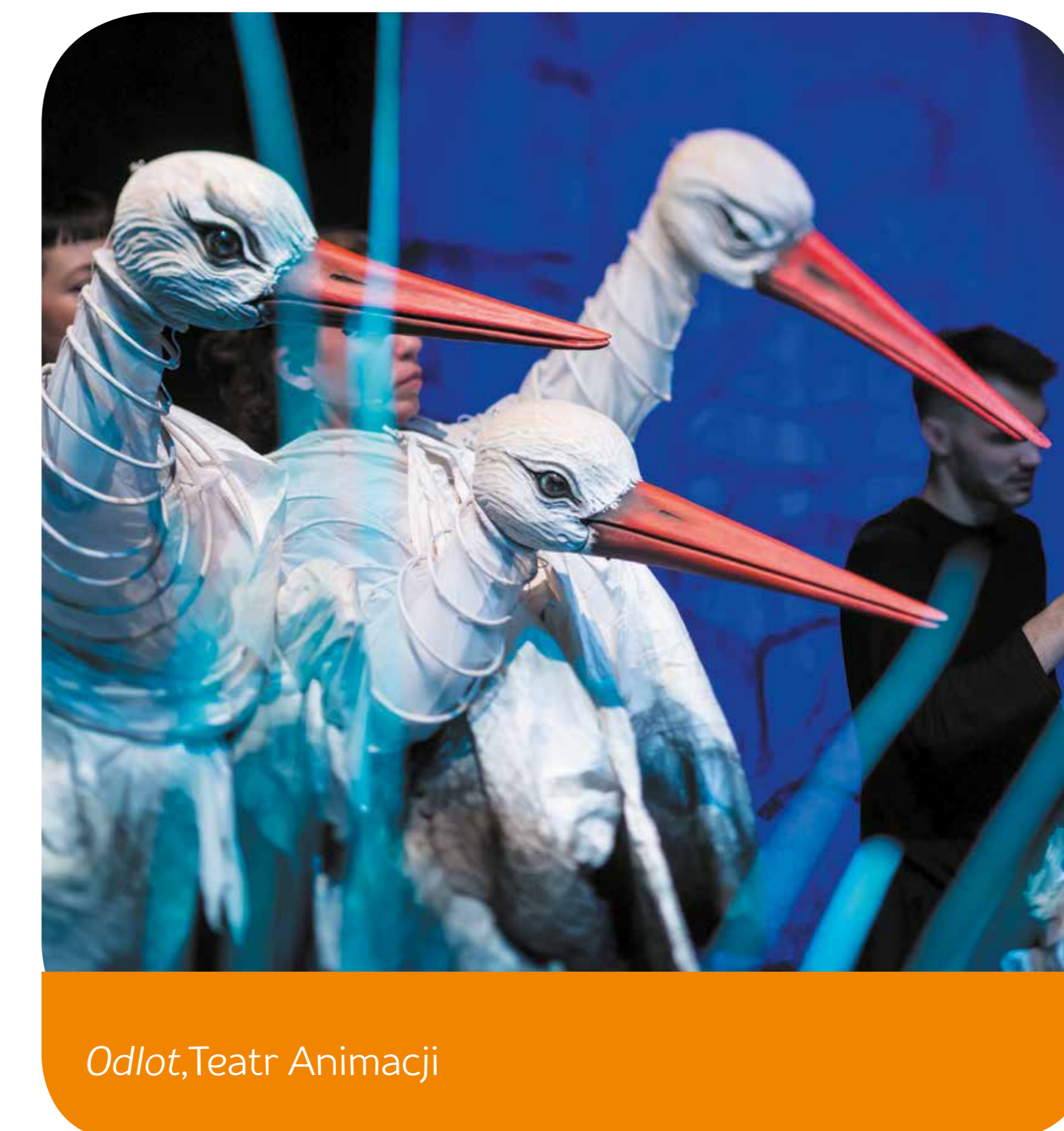
Odłot, Teatr Animacji

Afisz w wersji elektronicznej do pobrania na wmposnania.pl . Więcej informacji znajdziecie Państwo na stronie kulturapoznan.pl oraz w miesięczniku IKS. Redakcja nie bierze odpowiedzialności za zmiany wprowadzone po oddaniu materiału do druku. Informacje o wydarzeniach prosimy przesyłać na adres: afisz@wm.poznan.pl do 15. dnia miesiąca. Uwaga! Godzina podana przy spektaklach dotyczy tylko pierwszego pokazu.