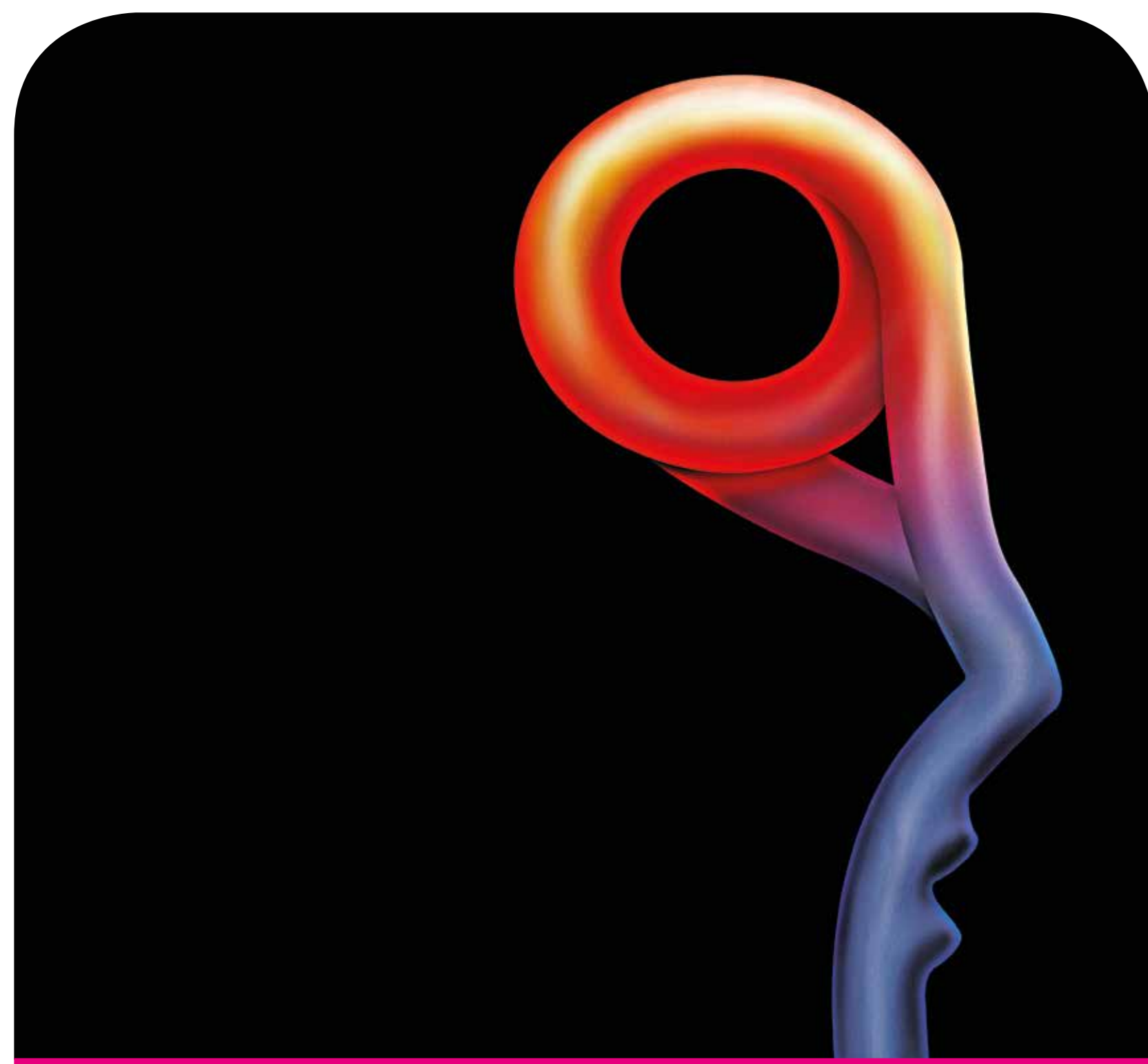
Festiwal Poznań Poetów, 15–20.05