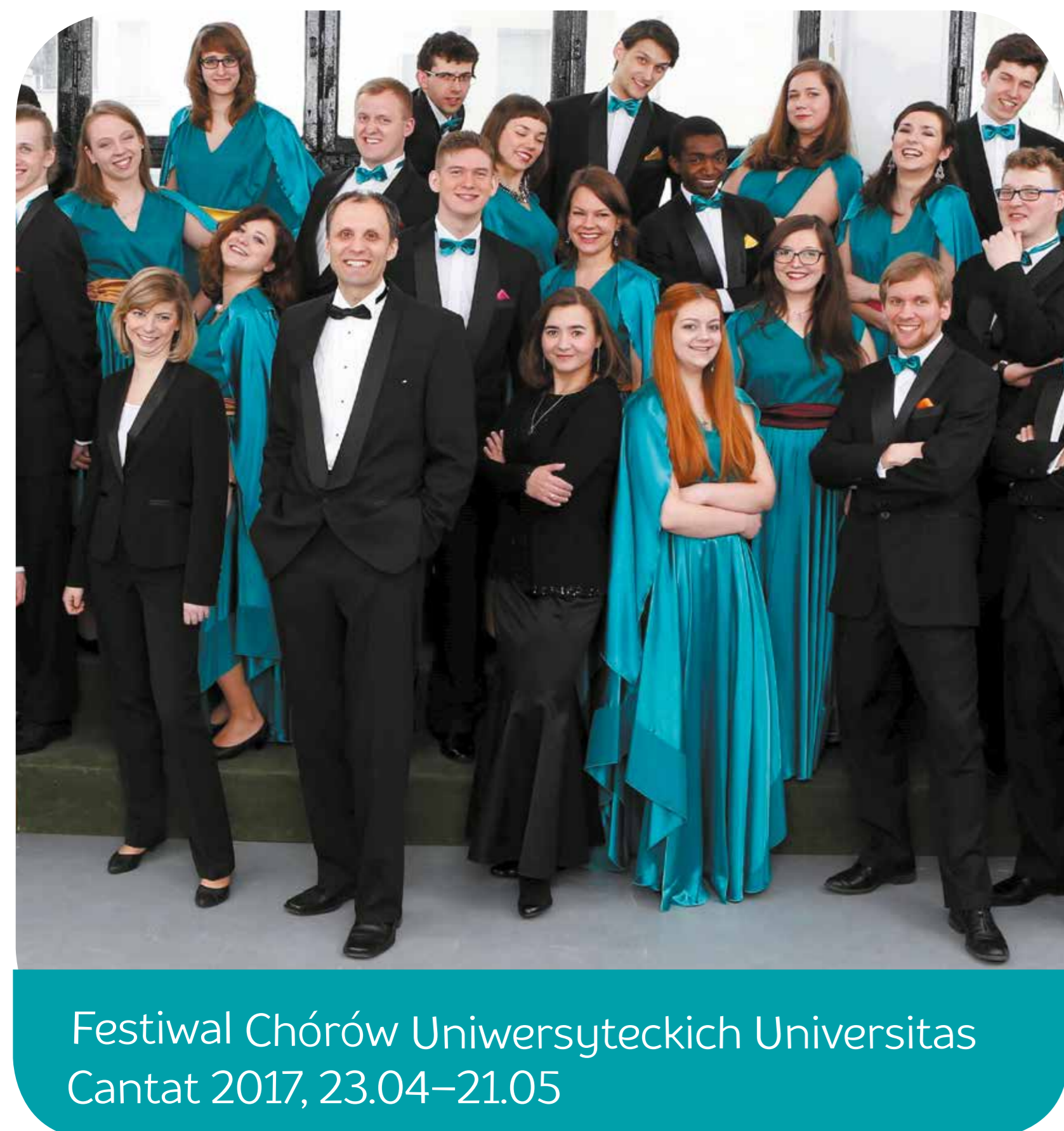
Festiwal Chórów Uniwersyteckich Universitas Cantat 2017, 23.04–21.05