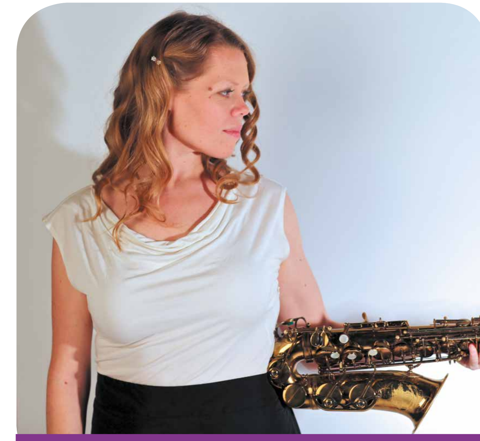
Festiwal Made in Chicago, 25–28.05

DKF Zamek: Całkowite zaćmienie , reż. A. Holland, CK Zamek, Sala Kinowa, g. 20.30