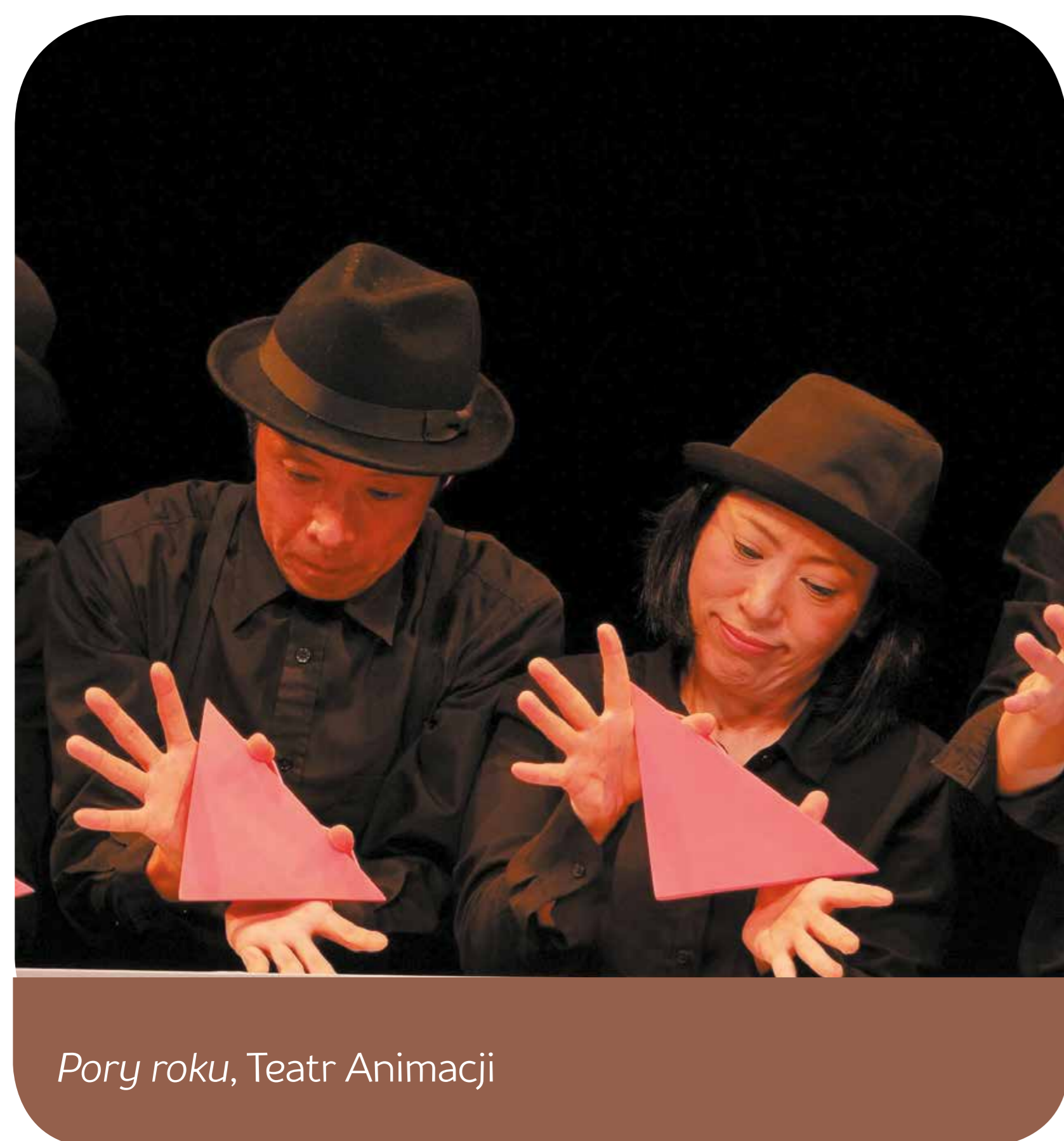
Pory roku, Teatr Animacji