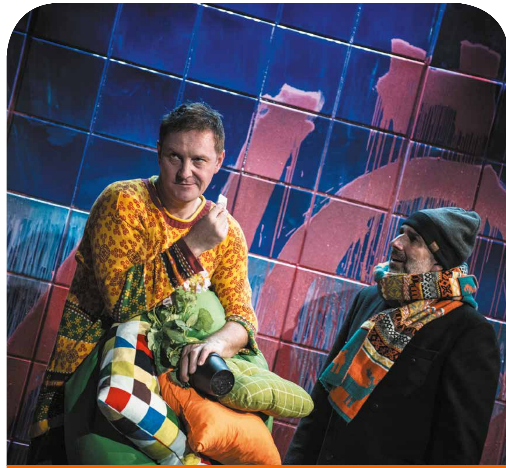
Spotkania Teatralne Bliscy Nieznajomi, 18–28.05