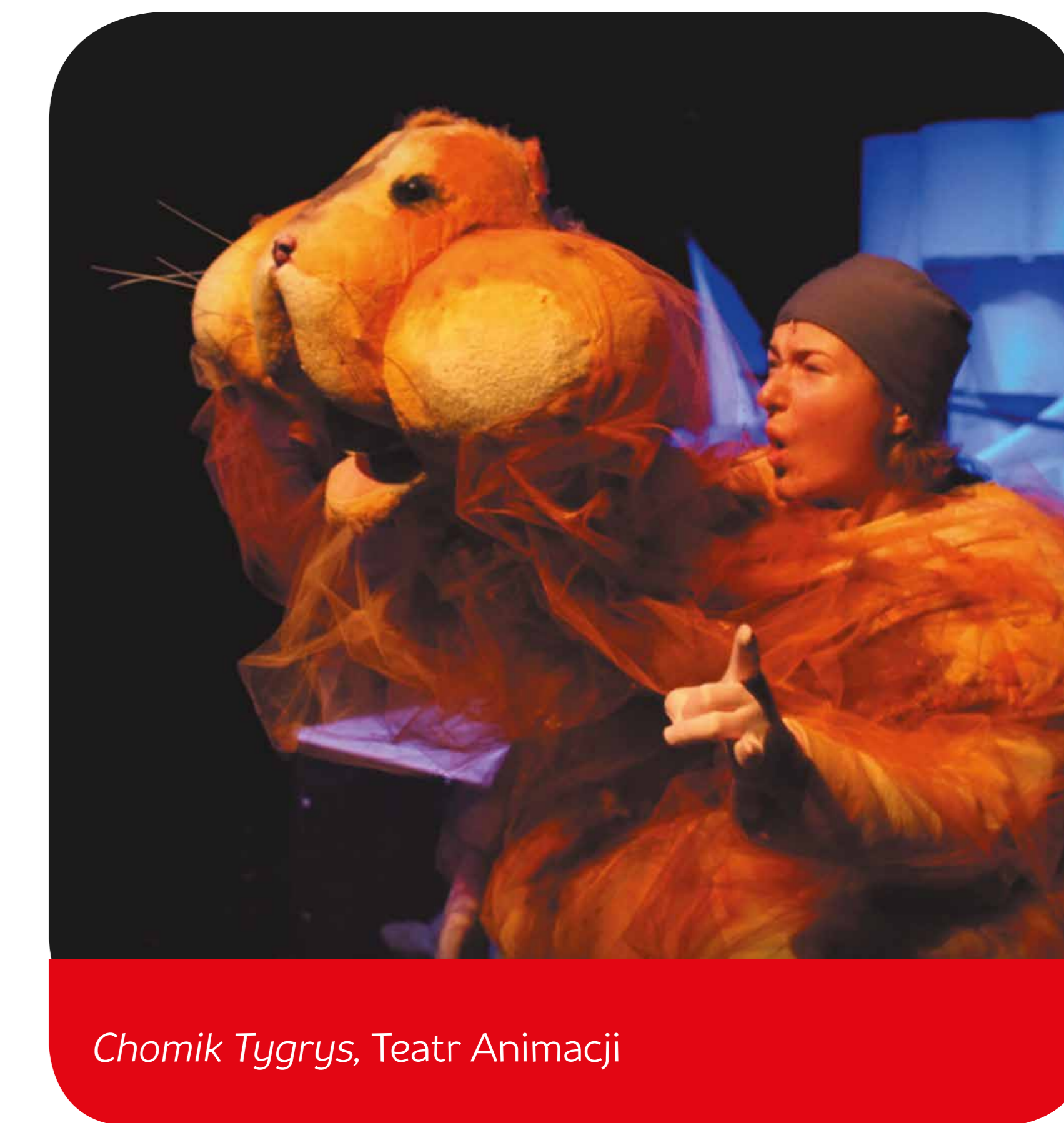
Chomik Tygrys, Teatr Animacji