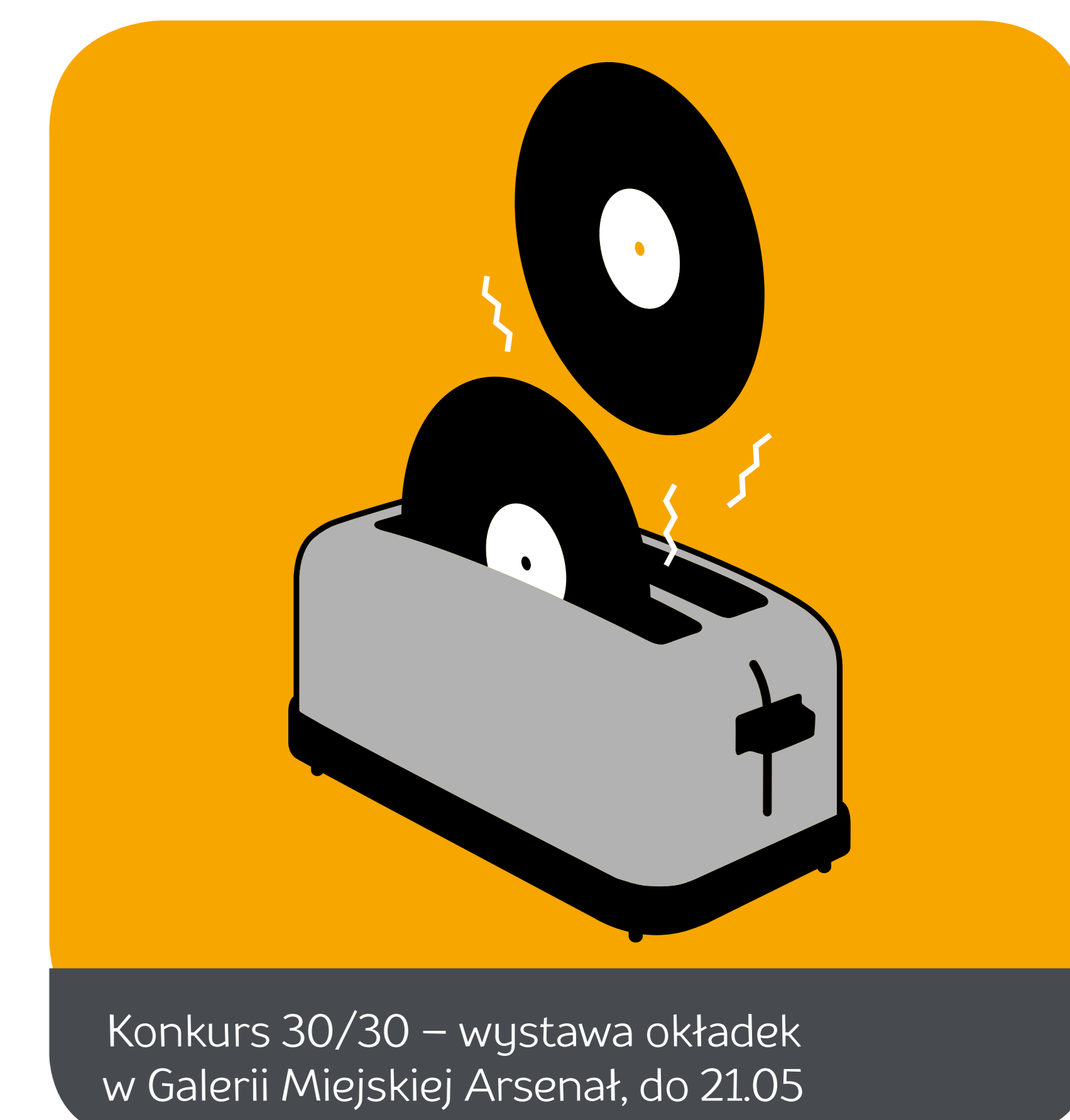
Konkurs 30/30 – wystawa okładek w Galerii Miejskiej Arsenał, do 21.05