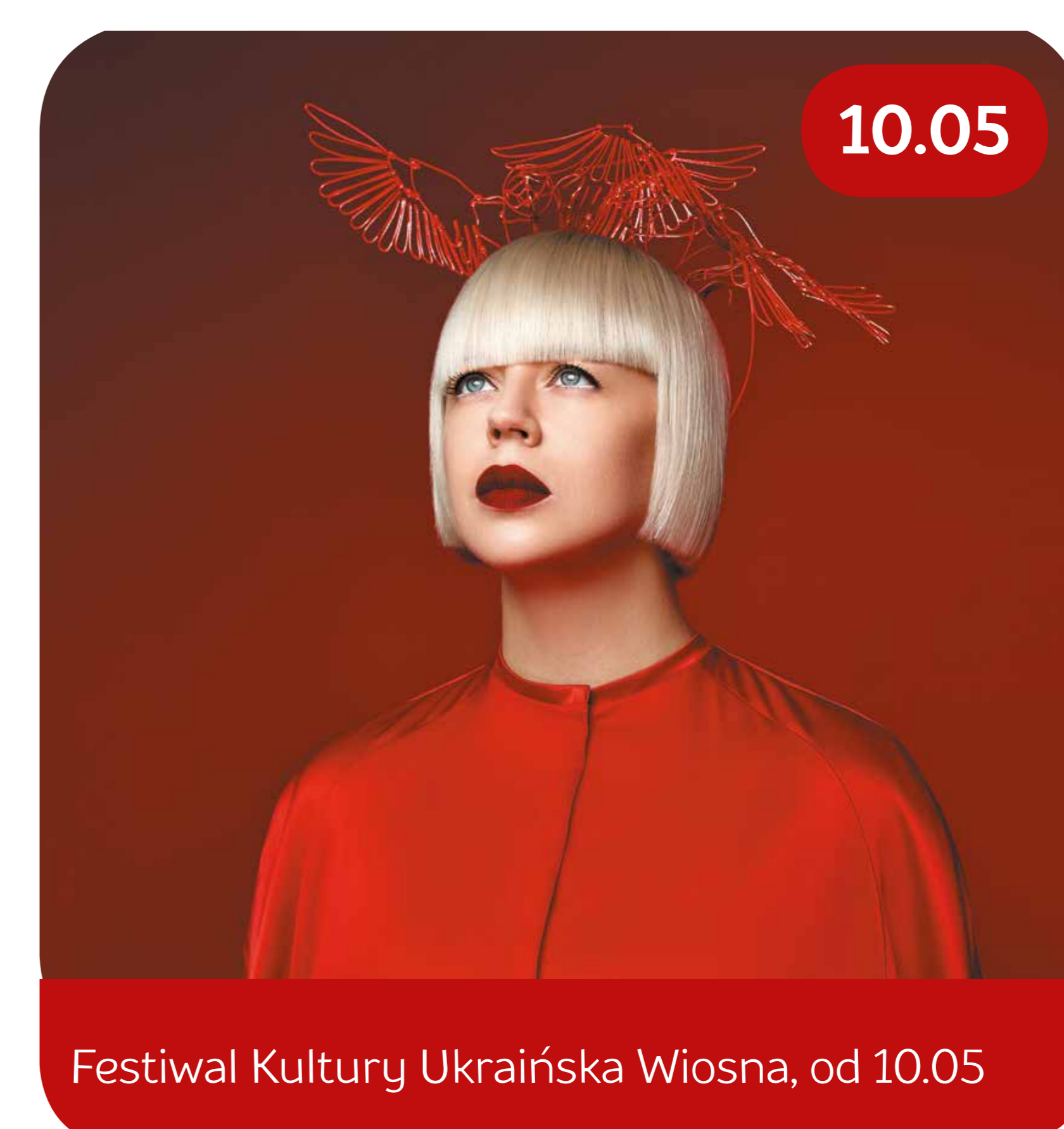
Festiwal Kultury Ukraińska Wiosna, od 10.05

Wernisaż wystawy Dzieciństwo – prace studentów Katedry Bizuterii ASP w Łodzi, czynna do 10.06, Galeria YES, g. 19