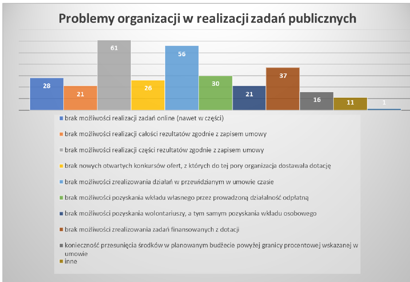
Wykres 3. Problemy organizacji pozarządowych związane z realizacją zadań publicznych na skutek działań prewencyjnych rządu

grant. W obu trybach zadania mogą być zlecane w formie wspierania (wymagany wkład własny) lub powierzania (całkowite finansowanie przez Miasto). Osoby biorące udział w ankiecie zostały poproszone o wskazanie trudności w realizacji zadań publicznych na skutek ograniczeń wprowadzonych przez rząd.