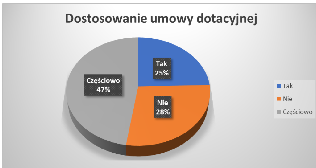
Wykres 5. Dostosowanie umowy dotacyjnej do aktualnej sytuacji epidemiologicznej (w %)