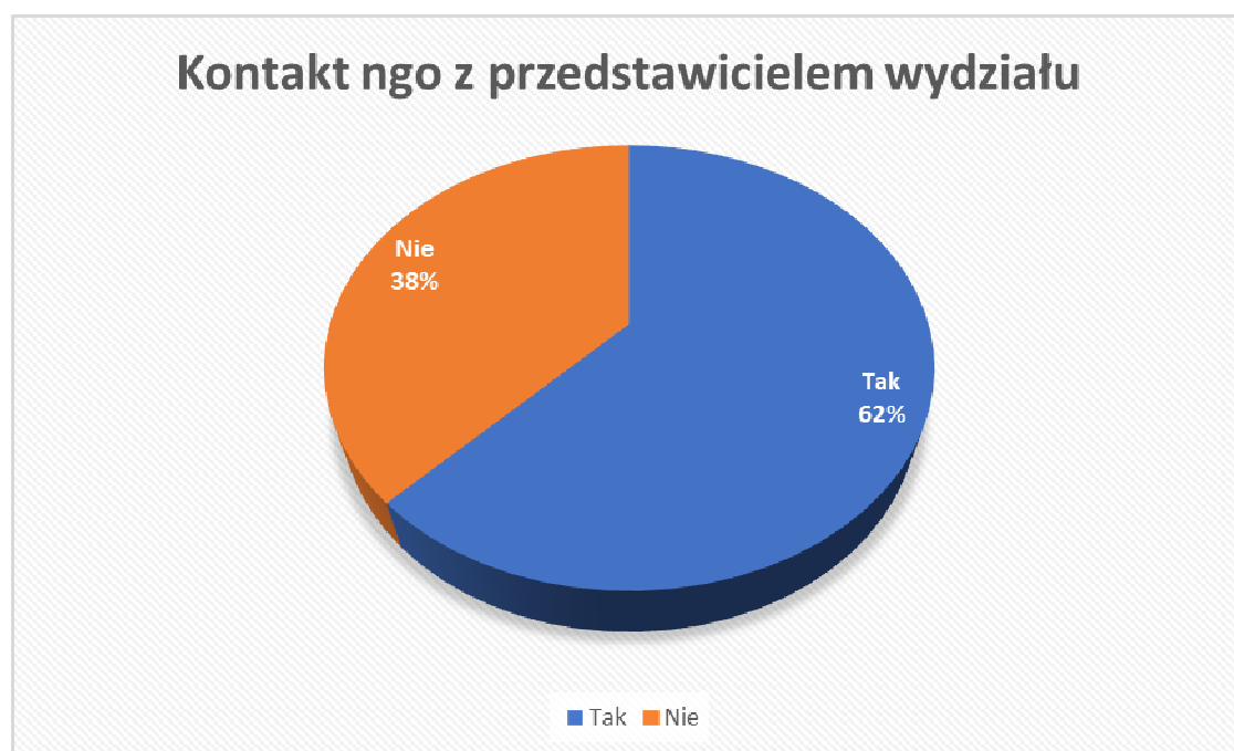
Wykres 4. Kontakt organizacji pozarządowej z przedstawicielem wydziału w sprawie zmiany umowy dotacyjnej (w %)

Organizacja pozarządowa zgodnie z ustawą o działalności pożytku publicznego i o wolontariacie podpisuje umowę o wsparcie realizacji zadania publicznego lub o powierzenie realizacji zadania publicznego. Umowy zawierane pomiędzy przedstawicielkami i przedstawicielami strony pozarządowej z samorządową stanowią element współpracy pomiędzy ww. sektorami. Zagadnienia dotyczące wykonania umów stanowią jeden z ważnych elementów realizacji zadań publicznych i mogły stać się źródłem problemów w sytuacji walki z pandemią. Czy organizacje pozarządowe kontaktowały się w sprawie aktualizacji umowy dotacyjnej z właściwym wydziałem merytorycznym, wskaże poniższy wykres.