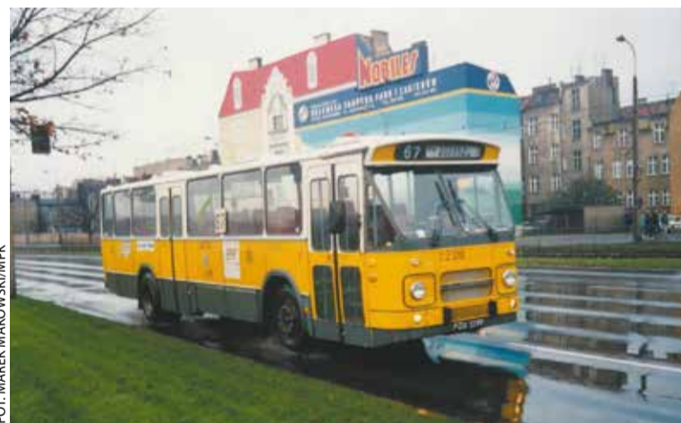
DAF MB200 na ulicach Poznania, lata 90. XX w.

oraz podwozia, zawieszenia i układu hamulcowego. Wymieniono podłogę i wykładzinę podłogową, porysowane szyby, uszczelki w oknach i drzwiach, laminaty boczne i wiatrolapy w przestrzeni pasażerskiej, odnowiono i obszyto na nowo siedzenia. Jednocześnie przywrócono autentyczne holenderskie przyciski i przełączniki, zamontowano oryginalne drzwiczki do kabiny kierowcy.