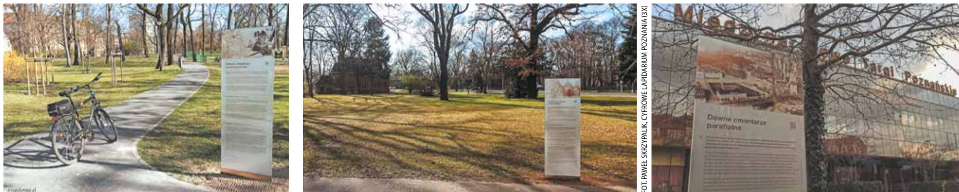
Tablica informacyjna w miejscu dawnego cmentarza staromarcińskiego (dzisiaj park Marcinkowskiego), cmentarza ewangelickiego (dzisiaj park Manitusa), cmentarza parafialnego (dzisiaj przed wejściem na MTP)

Dawne cmentarze wyznaniowe, zlikwidowane w ubiegłym wieku, zostały oznaczone tablicami historycznymi Systemu Informacji Miejskiej.