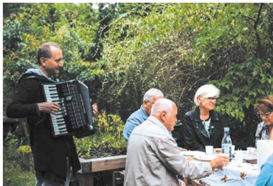
Konkurs „Czym jest dla Ciebie miasto Poznań?”

Organizatorzy są przekonani, że Poznań jest taki, jaki istnieje w doświadczeniu pojedynczych ludzi – mieszkanki i mieszkańców tego miasta, a także osób mieszkających poza Poznaniem i związanych z nim na różne sposoby.