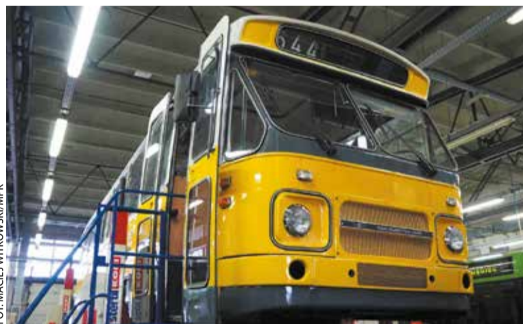
DAF MB200 podczas modernizacji

Do tej pory w MPK Poznań zachowany został, jako historyczny, jeden autobus: z numerem bocznym 1222 (wyprodukowany w 1982 roku). W poprzednim sezonie linii turystycznych nie był jednak wykorzystywany. Powód jest prosty – autobus był gruntownie remontowany. – Autobus został rozebrany na części i poddany drobiazgowemu prze-