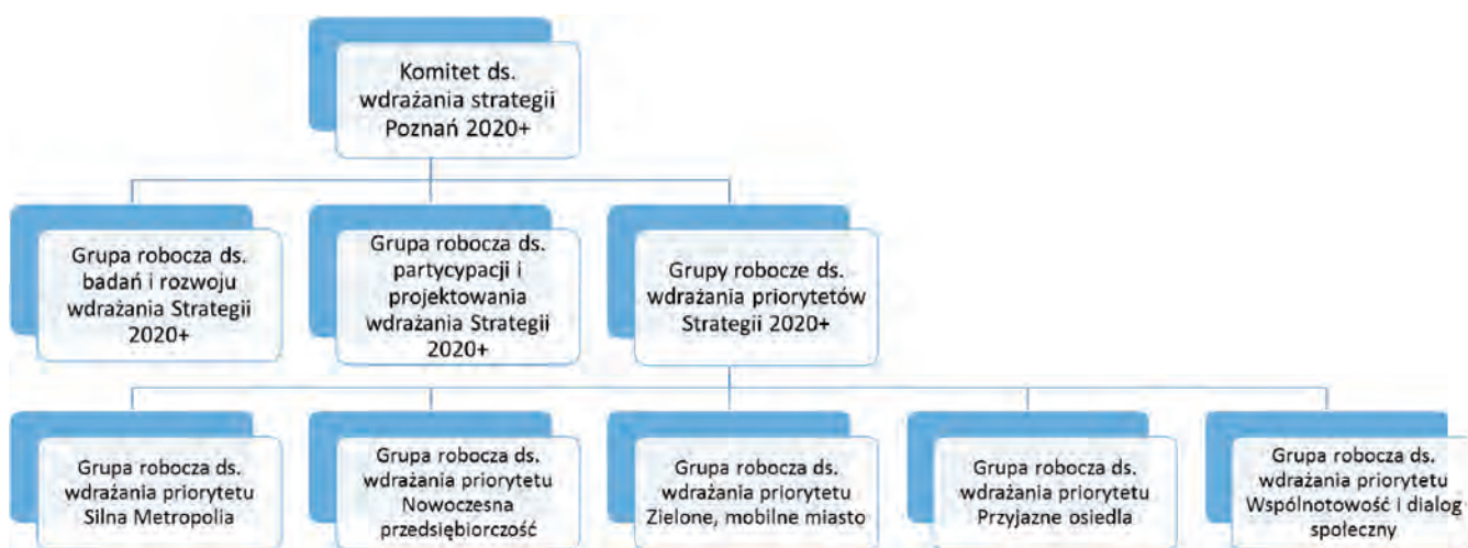
Schemat 1. Struktura podległości Komitetowi Sterującemu ds. wdrażania Strategii Rozwoju Miasta Poznania 2020+ w ramach systemu wdrażania strategii